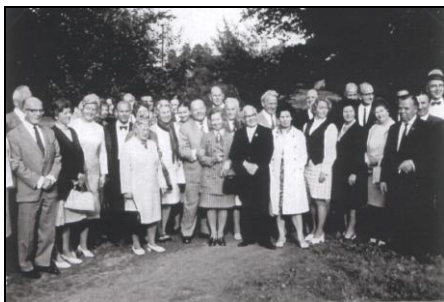
1. Wangeriner-Treffen am 26./27.09.1970