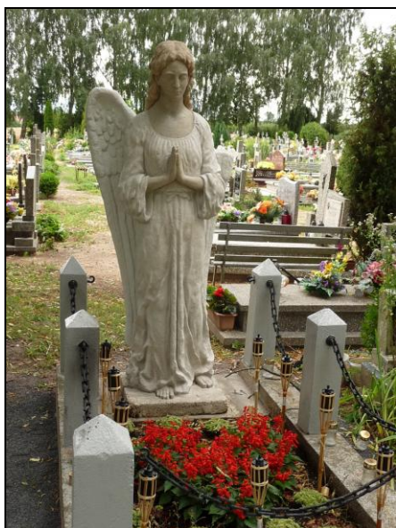
Grabengel von Otto Porath auf dem Wangeriner Friedhof